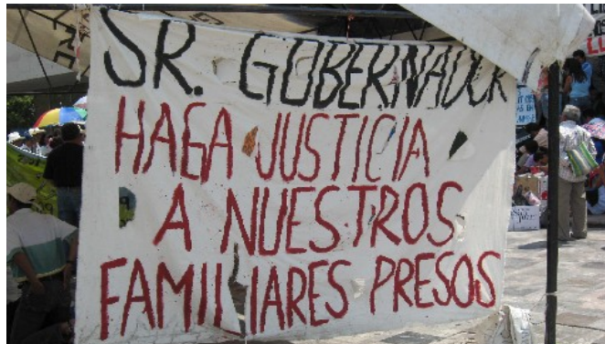
Demanda de familiares de presos frente al gobierno estatal.