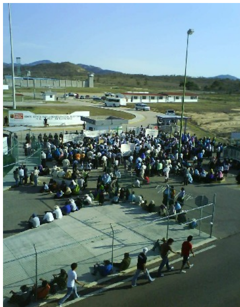
Protesta frente a cárcel estatal en Chiapas / CDH Frayba