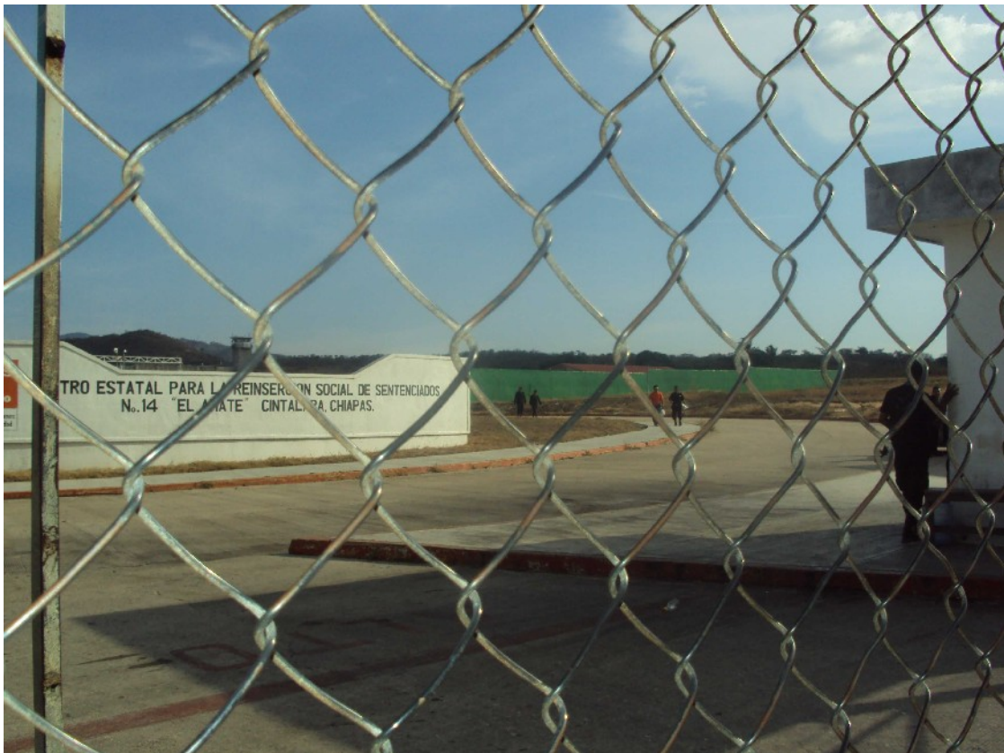
Aspecto de las rejas del CERSS No. 14 “El Amate”.

El día 29 de octubre de 2010, se presentó la esposa de Gilberto manifestando las condiciones en las que se encuentra su esposo al interior del penal: “desde hace un año lo operaron en 4 ocasiones de la pierna y siempre queda mal, y hemos gastado mucho” . En otra ocasión manifestó que “Gilberto fue transferido al área de 72 horas donde no puede dormir acostado, estando parado toda la noche con muletas debido a que no hay espacio para acostarse, y esto es preocupante porque está mal de la pierna.”